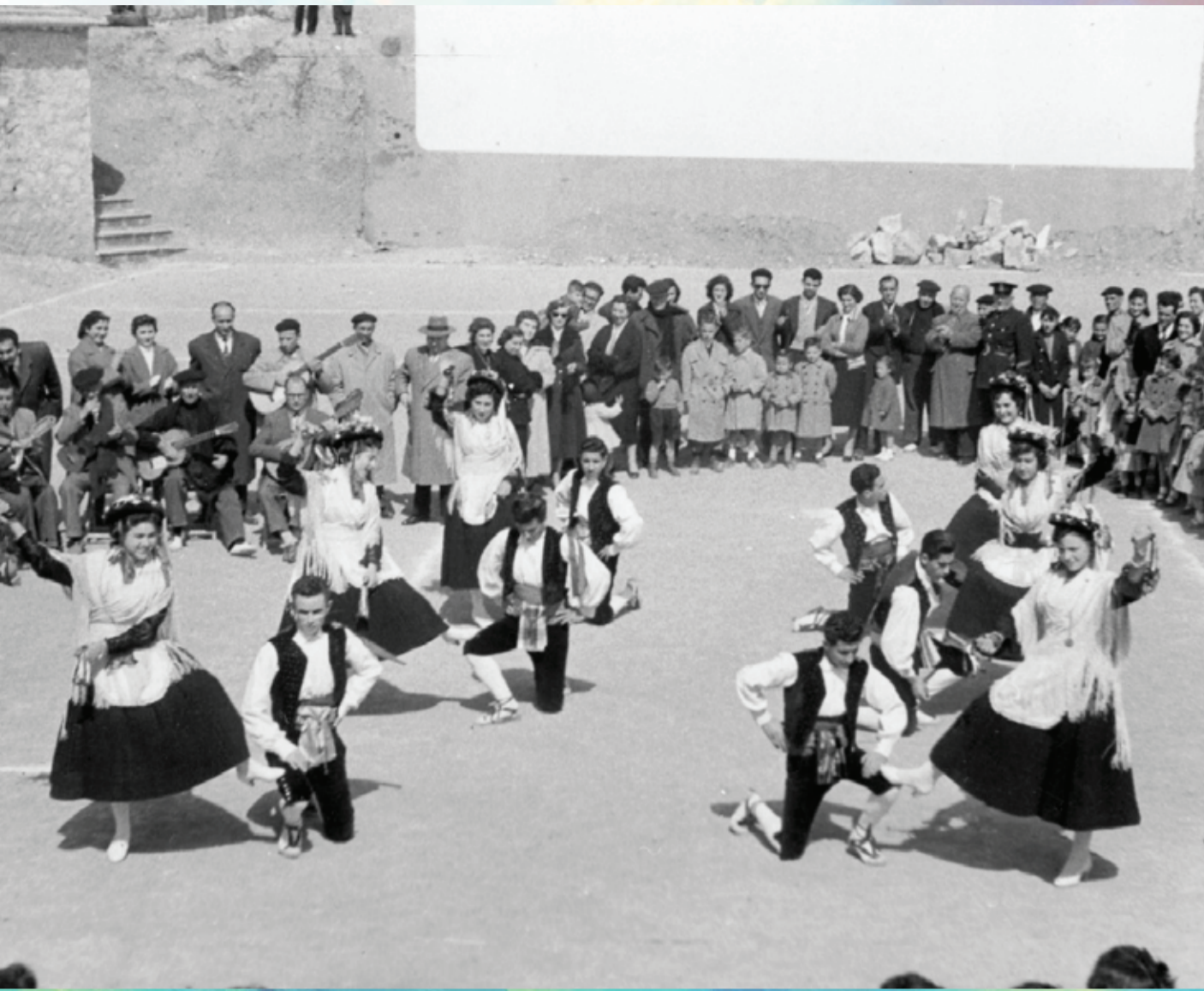
Actuación en el patronato del Grupo de Coros y Danzas de Ibi, cuyo 75 aniversario se ha celebrado en este año 2022. Fotografía de 1956, donada por Felicidad Bernabeu a l'Arxiu Municipal d'Ibi.