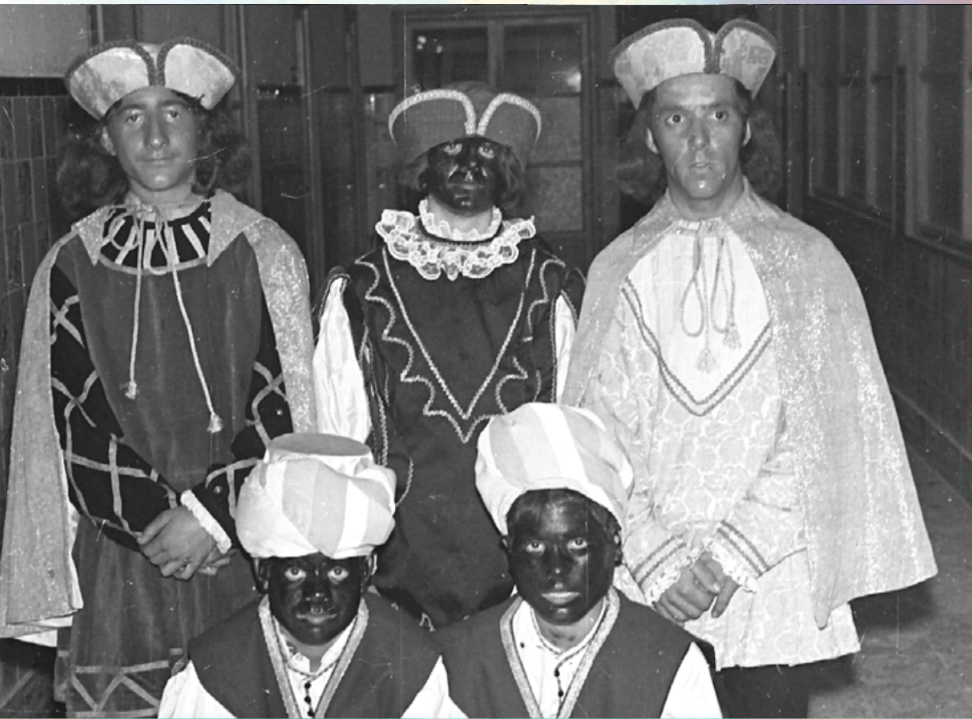
Pajes reales preparados para la recogida de cartas de los niños ibenses. Foto año 1969, archivo original Huertas.