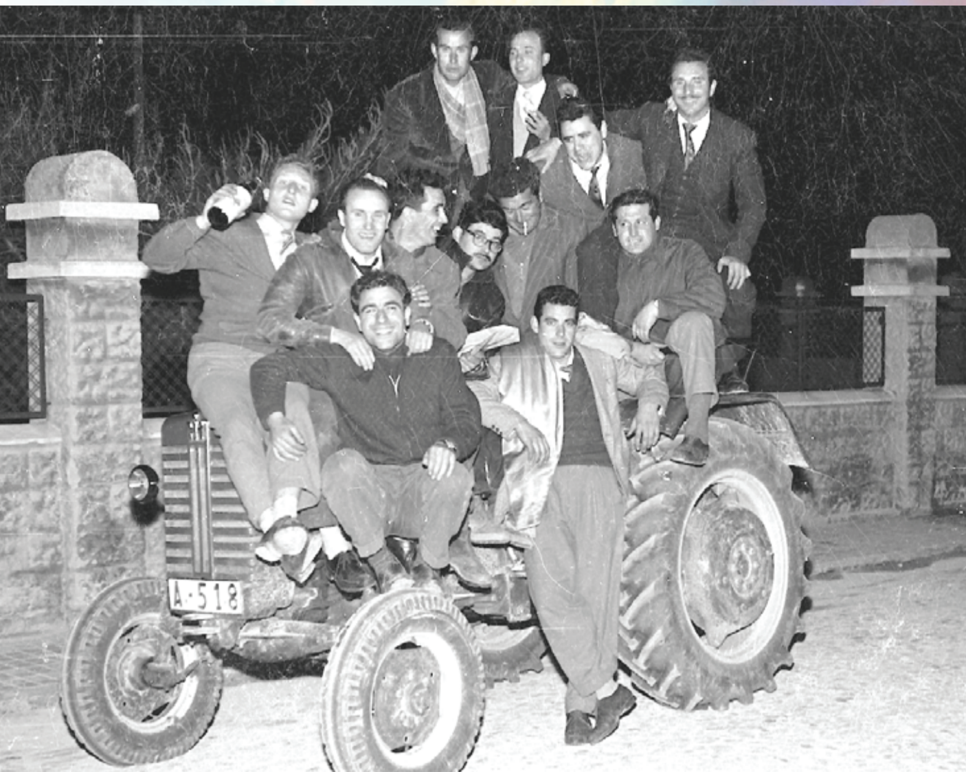
Instantánea de la celebración de unos amigos. No sabemos si el vehículo formaba parte de la celebración o simplemente era un lugar donde hacerse la foto. Foto años sesenta, archivo original Huertas.