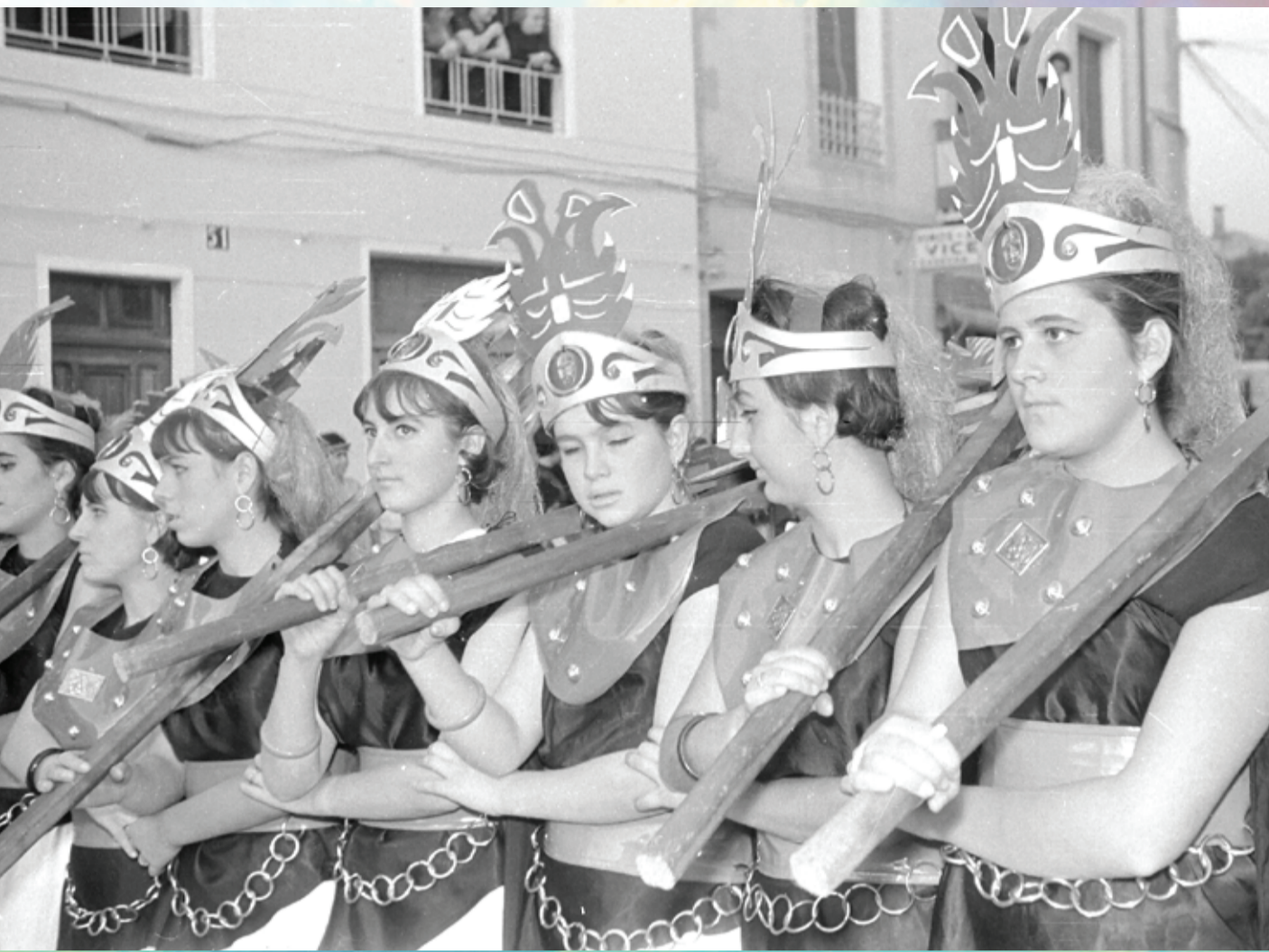
Imagen de una joven escuadra de mujeres en la entrada de nuestras Fiestas de Moros y Cristianos, que seguro no era habitual en aquellos años. Foto años setenta.