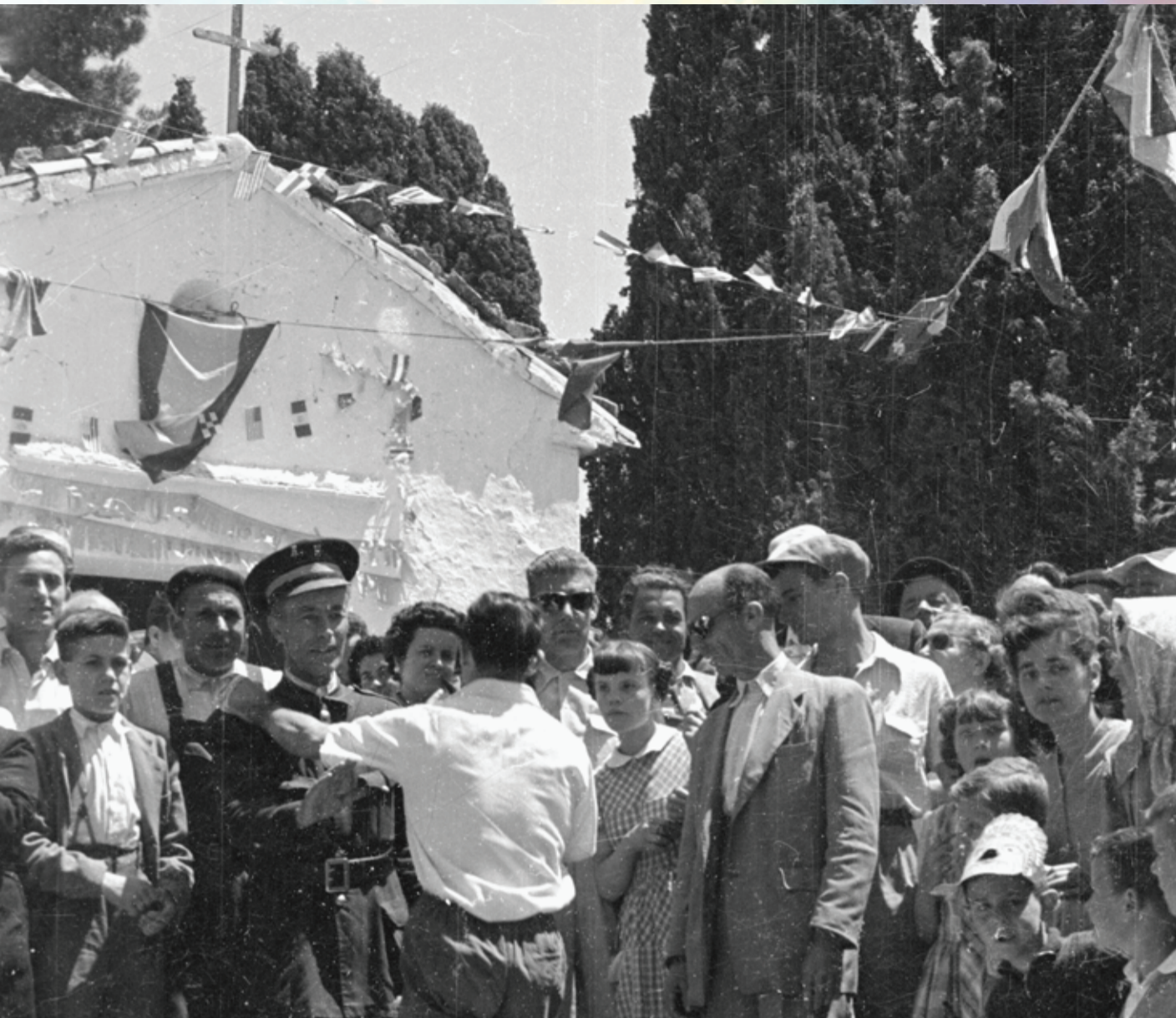
Imagen del ganador de unas de las carreras celebradas en la romería de San Pascual. Se puede apreciar al fondo la antigua ermita del Santo. Foto años sesenta, colección particular.