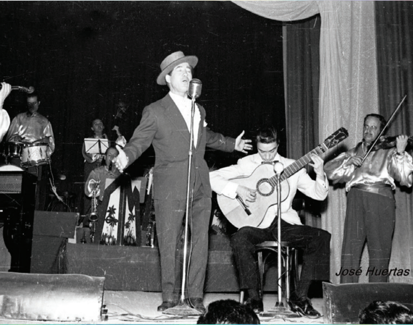
Imagen de la actuación de Juanito Valderrama en nuestra localidad, posiblemente en el desaparecido "Teatro Flora". Foto años sesenta, archivo original Huertas.