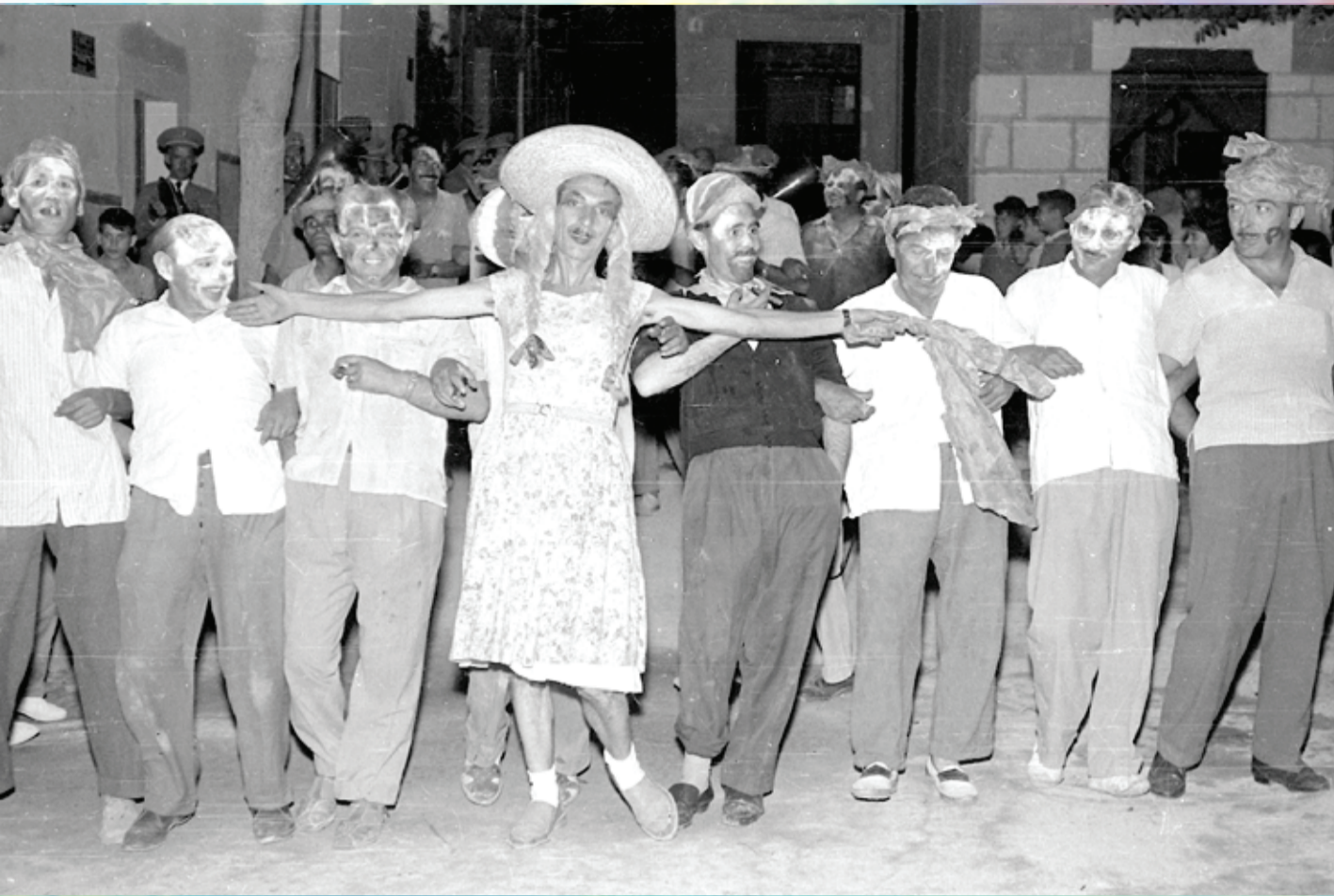
Imagen informal y divertida de lo que posiblemente serían los inicios de los actuales disfraces de la olleta de las Fiestas de Moros y Cristianos de Ibi. Foto años setenta, archivo original Huertas.