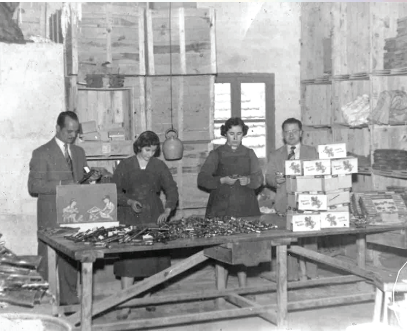
Imagen de la sección de montaje de una de las fábricas de juguetes de Ibi. Foto años sesenta, archivo original Huertas.